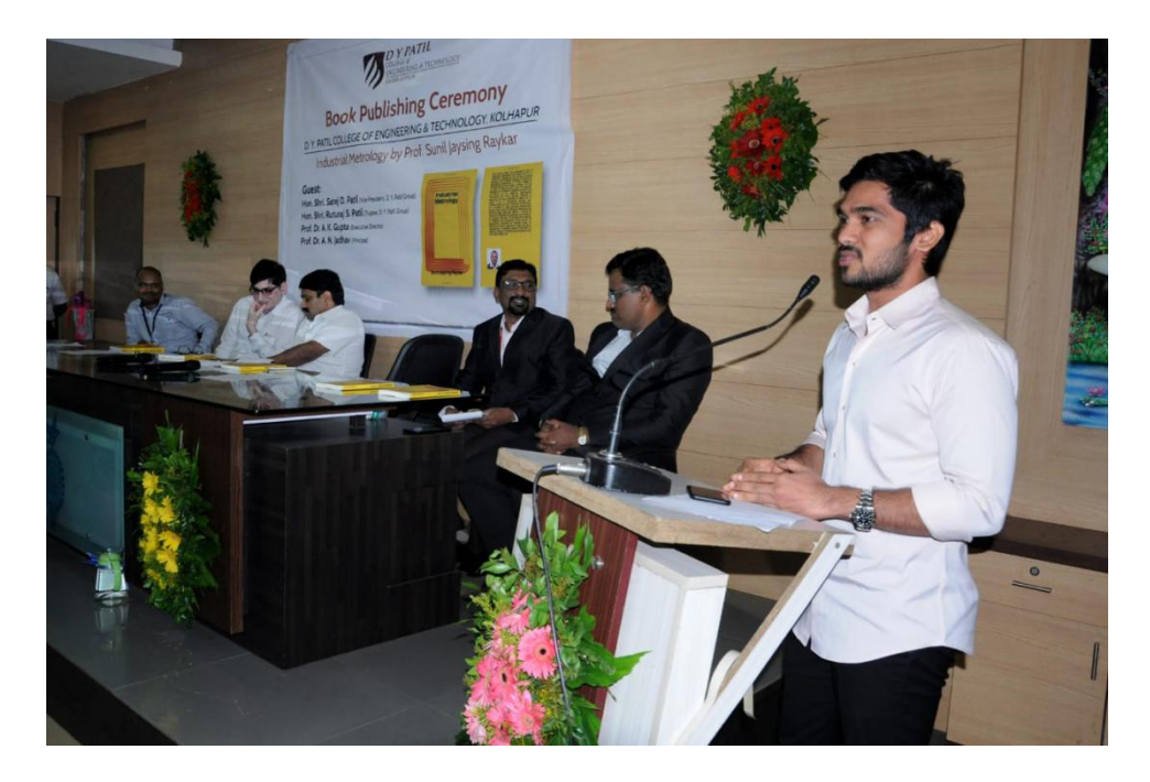
Hon. RuturajPatil addressing to the faculty